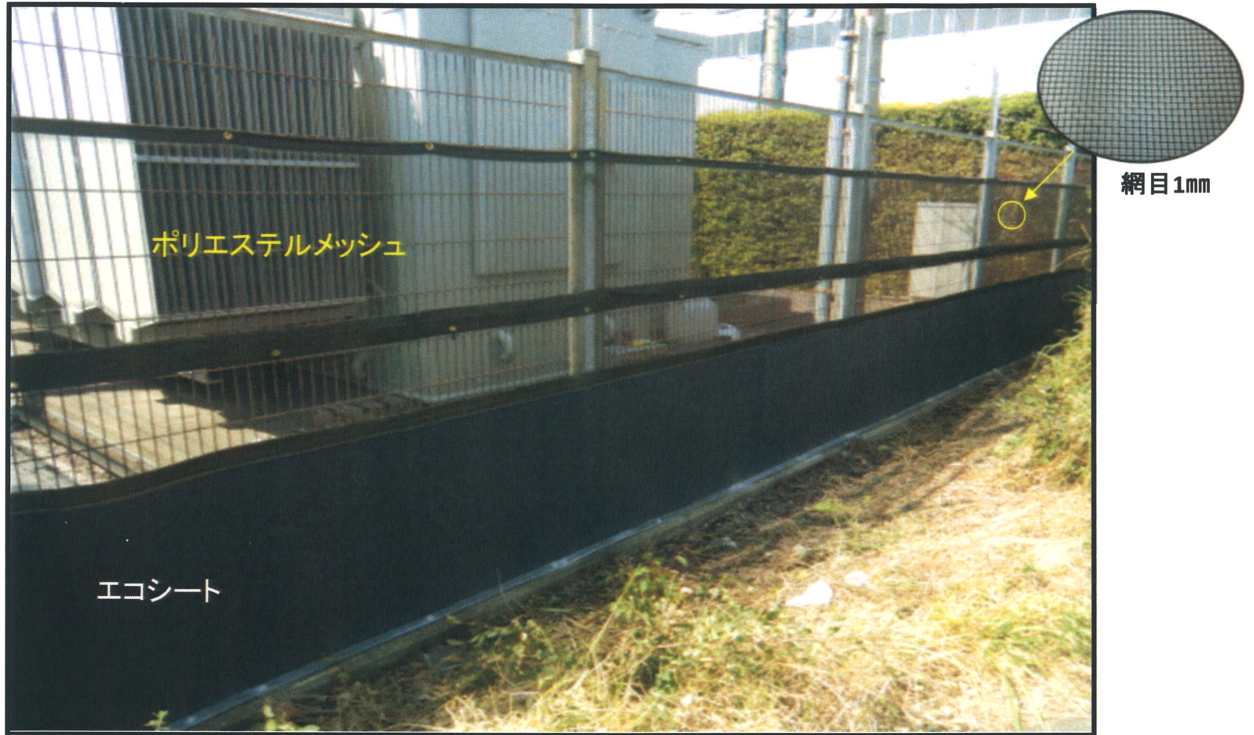
■ 施工場所: 大阪市内

保護柵に絡み付いたつる草を取り除く煩わしさと、つる草からの保護柵の損傷を防ぐ事が出来る製品として「つる巻き防止リサイクルシート」をご提案します。